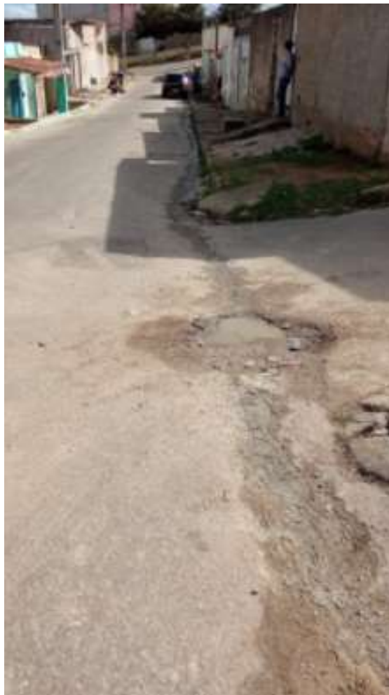
Foto de buraco no asfalto travessa 15 de setembro – Alto da conquista

(77) 3086-9600 Rua Coronel Gugé - 150, Bairro Centro, CEP 45000-510 Vitória da Conquista - BA