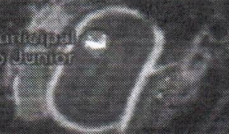
Planta de Localização da Rua TG 05 – Loteamento Alto da Boa Vista em Vitória da Conquista-Bahia