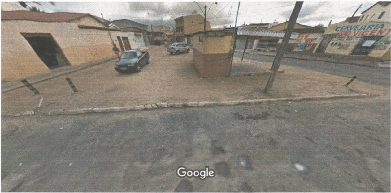
Captura da imagem: jul 2014